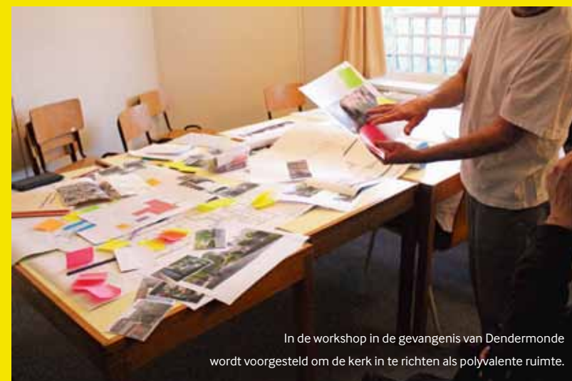
In de workshop in de gevangenis van Dendermonde wordt voorgesteld om de kerk in te richten als polyvalente ruimte.

Het detentiehuis is een model dat de vrijheidsstraf koppelt aan een behoud van wettelijk beschreven rechten