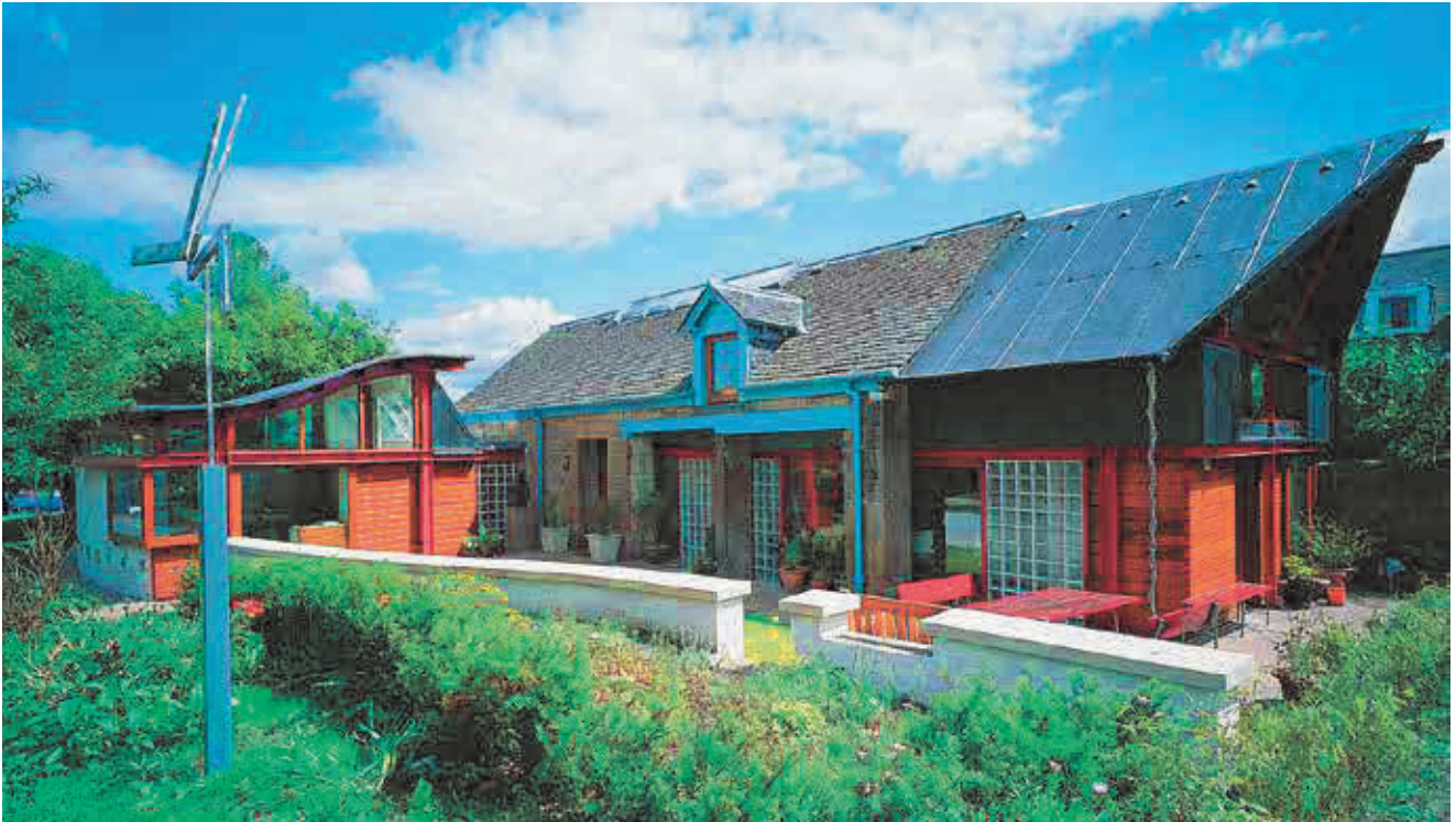
Maggie's Edinburgh, ontwerp: Richard Murphy Architects

Service die voluit de kaart trekt van iconische architectuur. De arts situeerde het belang van de uitzonderlijke kwaliteit in Maggie's niet in vermeende helende krachten, maar in de aangename werkomgeving. De stelling was: zorgpersoneel dat zich goed voelt, verstrekt betere zorgen aan de hulpbehoevende.