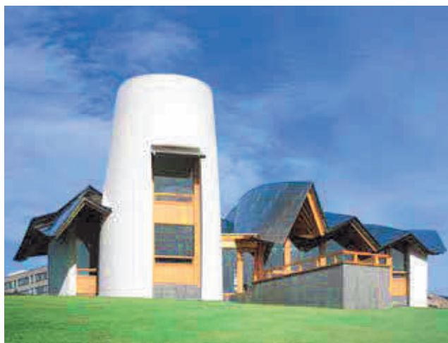
Maggie's Dundee, ontwerp: Frank O. Gehry