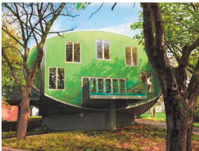
Maggie's Nottingham, ontwerp: Piers Gough

Jencks beschrijft vervolgens hoe hij in hetzelfde interview tegengesproken wordt door een arts van de National Health